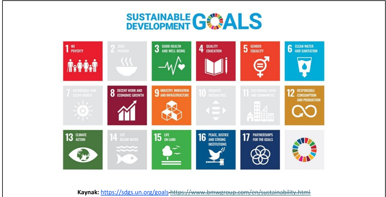
ŞEKİL 2. BM SÜRDÜRÜLEBİLİRLİK HEDEFLERİ

Direktif ayrıca AB’nin sürdürülebilir ve sorumlu üretim modellerini teşvik etmeye yönelik stratejik politika belgeleri ile de uyumlu şekilde tasarlanmıştır. Bu bağlamda Avrupa Yeşil Mutabakatı, Adil Bir Küreselleşme İçin Sosyal Adalet Konusunda ILO Deklarasyonu 37 , Avrupa Sosyal Haklar Yapıtışı 38 ve AB İnsan Hakları ve Demokrasi